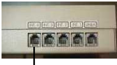
Interno 4: Los dos hilos interiores para conexión de interno Los dos hilos exteriores para conexión de portero a 2 hilos

El portero a dos hilos suena en los telefonos pero no tiene abrepuertas.